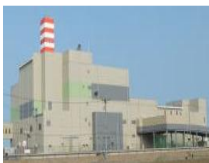
岩沼東部環境センター(ぼぼか)