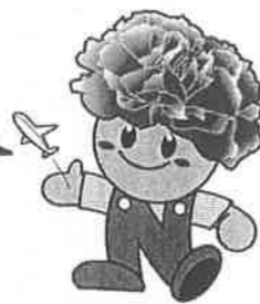
名取市マスコットキャラクター