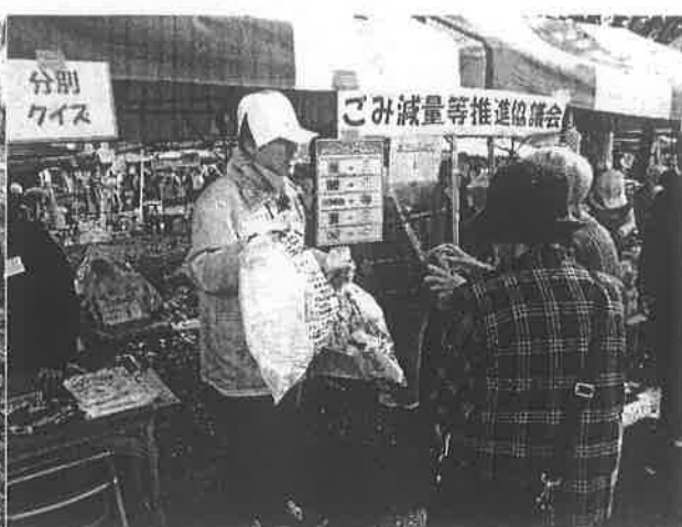
ごみの出し方変更周知コーナー