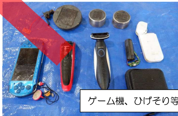
ゲーム機、ひげそり等