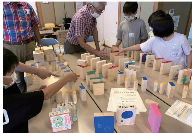
手作りドミノ大会

6月から11月にかけて小学校の校門脇花壇に登下校の際に楽しめるようチューリップ、パンジー、葉牡丹など季節を感じる花植作業を行いました。7月に親子レクリエーションとして公民館と共催して「手作りドミノ大会」を開催しました。ドミノを作り、色を付けて仕上げ、9月にはドミノレースを体育館で楽しみました。2月には「もちつき大会」を実施します。子どもたち、地域の皆さまと楽しく過ごせる行事を実施していきたいと思います。