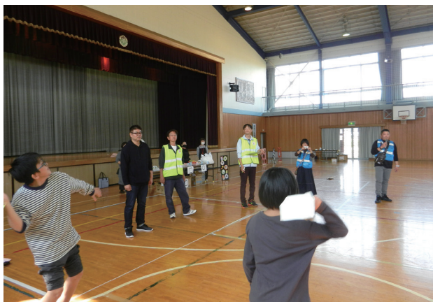
紙ヒコーキ飛ばし

今年度の親子レクリエーション「親子のつどい」は10月28日に実施しました。小学校の学習発表会終了後、昼食(今年もインスタント芋煮を提供)を親子で食べてからレクリエーション開始です。最初の紙ヒコーキ飛ばしでは、校長先生の試技から始まり、大人も参加して飛距離を競いました。好成績の児童にはメダルを授与しました。その後は、水ヨーヨーすくいや工作コーナー、輪投げ、ストラックアウト、お楽しみコーナーなどで楽しんでいました。