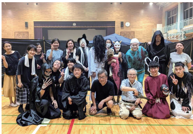
不二小肝だめし大会

8月に不二が丘小学校体育館で4年ぶりに「肝だめし大会」を行いました。子どもたちの夏の思い出になるよう、PTA、育成会、地域の皆さんが集まり力を合わせました。お化け役には、お父さん方や高校生、大学生。中学生もスタッフとして参加してくれました。育成会は縁の下の力持ち。いつもの体育館をお化け屋敷に大改造。何年間も協力して下さっている地域の方々もいます。当日は140人の子どもたちが泣いたり、笑ったりと大いに盛り上がりました。