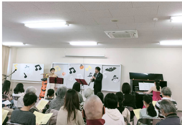
アンサンブル演奏会

親子レクリエーションとして「地域力お宝たんけん」との共催で「フルーツ・ピアノ・クラリネットによるアンサンブル演奏会」を行いました。童謡、クラシック、ジブリの曲など、プロの生演奏を間近で聴ける、大人も子どもも惹き込まれる楽しいひとときでした。12月には小中学生を対象とした「親子トレーニング教室」を行いました。他にも、ゆりが丘小学校の花壇整備を行いました。来年度も親子で楽しめるイベントを開催できるように活動していきたいと思います。