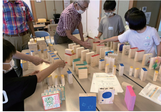
手作りドミノ大会

6月から11月にかけて小学校の校門脇花壇に登下校の際に楽しめるようチューリップ、パンジー、葉牡丹など季節を感じる花植作業を行いました。7月に親子レクリエーションとして公民館と共催して「手作りドミノ大会」を開催しました。ドミノを作り、色を付けて仕上げ、9月にはドミノレースを体育館で楽しみました。2月には「もちつき大会」を実施します。子どもたち、地域の皆さまと楽しく過ごせる行事を実施していきたいと思っております。