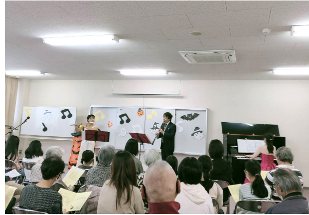
アンサンブル演奏会

親子レクリエーションとして「地域力お宝たんけん」との共催で「フルート・ピアノ・クラリネットによるアンサンブル演奏会」を行いました。童謡、クラシック、ジブリの曲など、プロの生演奏を間近で聴ける、大人も子どもも惹き込まれる楽しいひとときでした。12月には小中学生を対象とした「親子トレーニング教室」を行いました。他にも、ゆりが丘小学校の花壇整備を行いました。来年度も親子で楽しめるイベントを開催できるように活動していきたいと思っております。