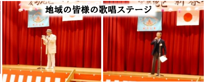
地域の皆様の歌唱ステージ