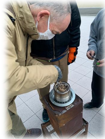
金具を使った「火起こし体験」…悪戦苦闘を経て最後は見事に着火成功!