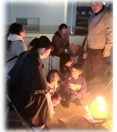
また焚き火したいね〜 🔥