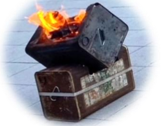
講師が製作した一斗缶を組み合わせた焚火台 🔥

すっかり日も長くなり、10月末から始まった「焚き火講座」も3回目の最終回を迎えました。子供から大人まで、参加者の顔ぶれもお馴染みさんが増え、憩いのイベントとして少しずつ定着してきたようです。