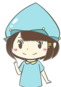
名取市水道マスコット ずいちゃん