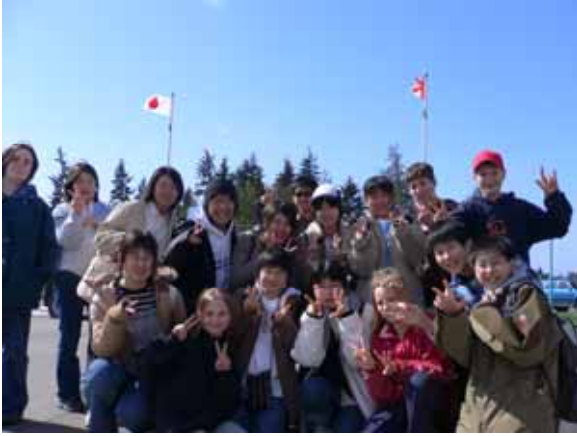
ジャーニー・ミドルスクールでは日本国旗を掲げて団員たちを歓迎してくださいました。