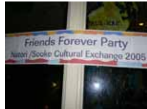
お別れパーティの“Friends Forever Party”というタイトルに感動!

ルの生徒たちが、来年の三月に名取市を訪問する予定です。 現地の先生からは「今回の交流以降、たくさん生徒が名取市訪問を希望しています。生徒を選ぶのが大変になりそう!」と、うれしい悲鳴(?)が寄せられています。 詳しいことが決まりましたら皆さんにお知らせしますので、ぜひご協力くださいますようお願いいたします。