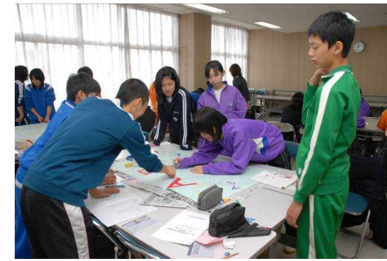
それぞれのチームポスター作成中