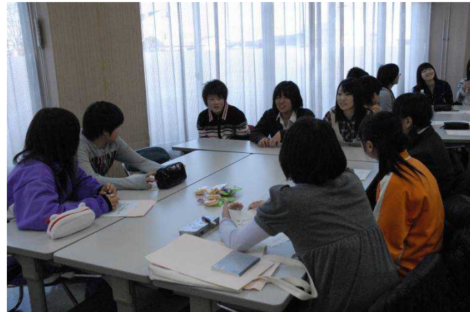
カナダではこんなことするといいよ！と先輩たちがアドバイス