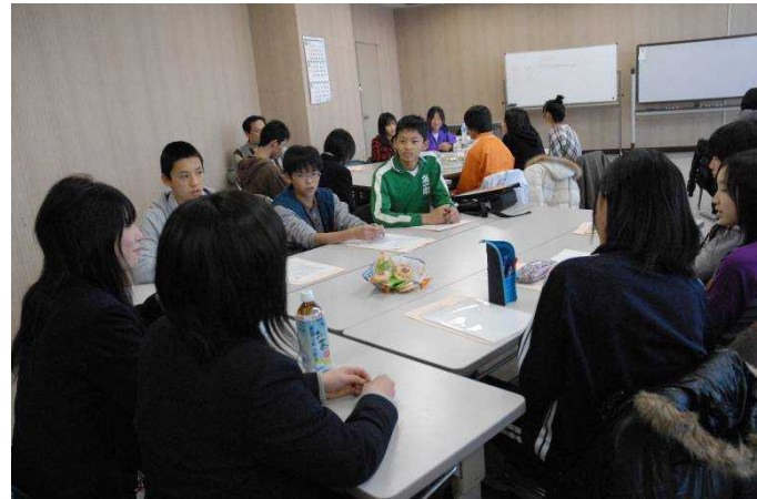
団員たちは真剣に先輩たちの体験談を聞いていました