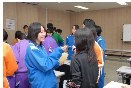
自己紹介ゲームでお互いの緊張がほぐれました