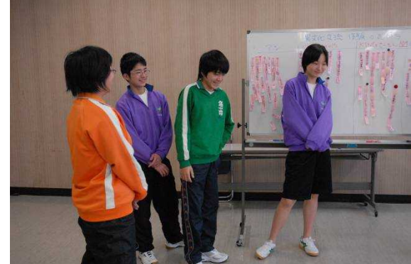
異文化についてゲームをしながら学びました

OB、OGの体験談 平成十八年度にカナダに派遣された先輩方にアドバイスをいただきました。食べ物やホームステイ先での生活などの情報を聞き取りました。心強い研修となりました。