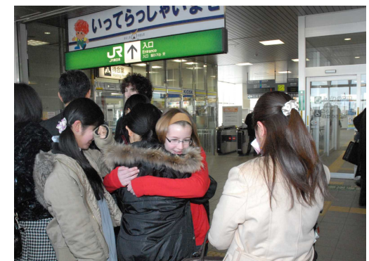
3月12日(金)とうとう旅立ちの日。 「ありがとう。元気だね!」

たそりがと... (transcription of vertical text)