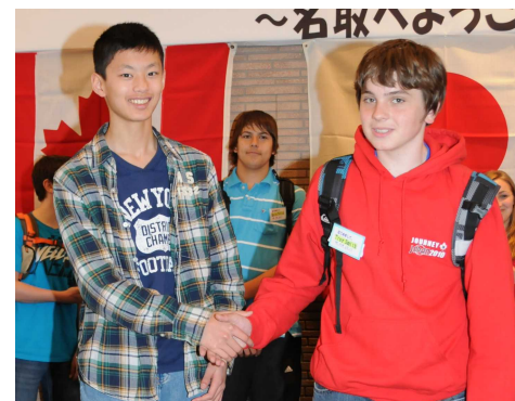
一年ぶりの再会に喜ぶ二人。「名取へようこそ！」