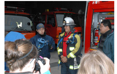
なかなか似合うでしょ!?

間があつという三月間... (transcription of vertical text)