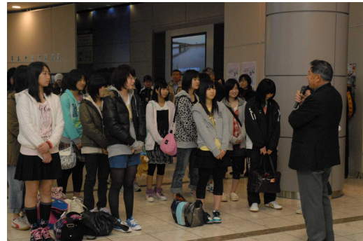
大雪の中、早朝6時30分に仙台空港に集合した派遣団員 左の写真は壮行式の様子です

飛行機が欠航となり、新幹線で中部国際空港のある名古屋へ移動 スタートが一日遅れてしまいましたが元気に出発!