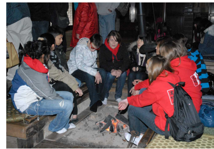
洞口家住宅にて。いろいろは温かいね!

まるとな問市まい続... (transcription of vertical text)