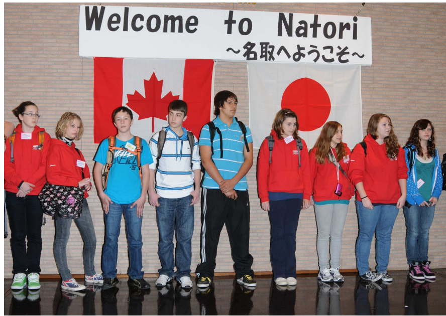
3月7日(日)に行われた対面式の様子。期待に胸を躍らせるたり、昨年会った友だちの再会にわくわくしたりしながらステージに並びました

クジャーニミッドルスクール訪問団のメンバーは、今年3月から4月にかけて市内に在住する中学生が訪問した。訪問期間は3月7日(日)から10日(水)まで、市内の中学校を訪問したりと充実しながら、日本文化を体験したり、