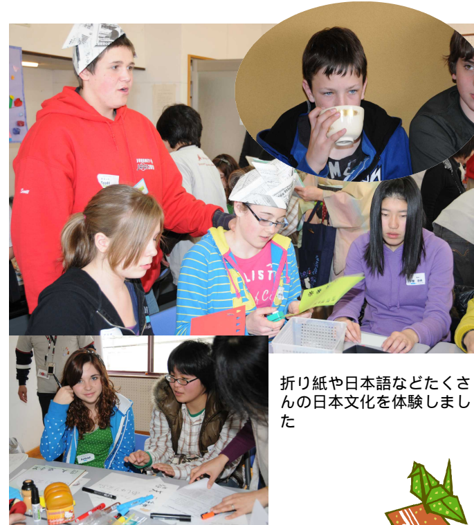
折り紙や日本語などたくさん の日本文化を体験しました

まるとな問市まい続... (transcription of vertical text)