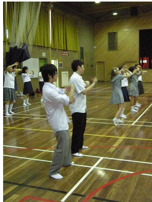
合同でダンスの授業を体験。簡単そうに見えて意外と難しい！

「日本：オーストラリア 5:5 互いのよさを実感!!」 「国境を越えた友情」 「外国で最高の友達と出会えて本当に嬉しいです」 「心からの感謝と心からの笑顔と心からの感謝」 「オーストラリアの人は心が広い!!!」 「ホストファミリー大好き！」 「Warm」