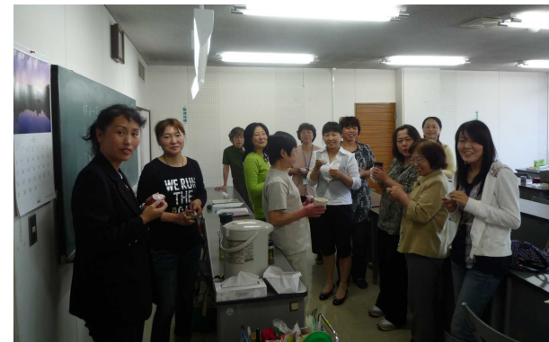
日本語教室で勉強している皆さん。講座のほかにティータイムもあり、和やかに勉強しています

講座は和気あいあいとして、日本語を教えながらも各国の文化も学ぶことができ、お互いに充実できる機会です。一緒に海外出身者の言葉のお手伝いをしませんか?