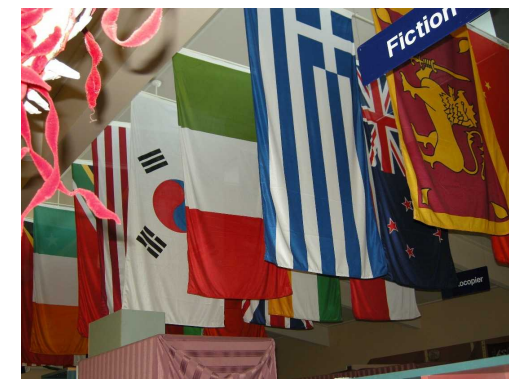
学校の廊下には在学している生徒の国旗が掲げてありました

すと目た し達団こなたしやテす一どケ ト。な、ホやた。のたもて、ら文で初ひツシ積 フおつと「っ。のたちあしホい化生めとシヨ極 ア世てうムと たはりま「いにのてりヨンの ミ話しとス慣 めはりま「いにのてりヨンの りにまうテれ にミま「の触英のさんをはと 「ない出イた 努力したシかれ語ホ「ざ、る とつま発五と 力シたりツ戸、の「の、ま のたしの日思 しヨが、すく感ど速ム大団「ユ 別ホ 日 しまん、るに「うさスで員なニ