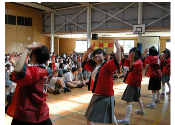
歓迎会では研修で練習したソーラン節を披露

ト変体した前し演にバ会学 た。スる本スチ た。かり校 ウで育まソ研た。奏より。校授。のほ語でユ学。りする エし館し！修。でる！マの業 授かのー！校 慣る イたでた。ラで派歓「校ウ体を 業、授緒デで れた バがの。ン練遣迎君のン育受 を合業にンは たる リ、踊蒸節習団をが生ト館け 受同を数トホす よ 「マリしをし員受代徒ウでた けで体学のスト よ 校ウは暑披てはけ「た工歓後 しまダ験やクト はず のン大い露き事まのちイ迎は しンす日ラス