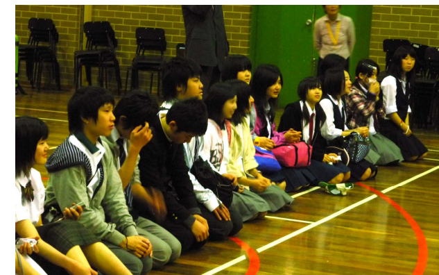
いよいよホストファミリーと対面。緊張でドキドキの団員たち

訪問は、オーストラリアのモナッシュ市に滞在し、現地での生活体験や文化交流など、貴重な体験が待っています。