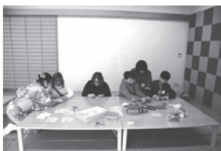
扇子に漢字で自分の名前を書いたり、折り紙をしたり日本の文化にふれました。