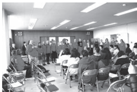
ホストファミリーとの対面式の様子。