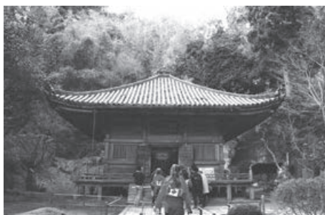
松島を散策しました。