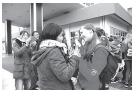
お別れのとき。「また会おうね」。