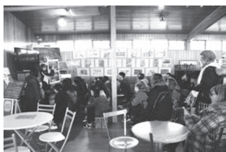
メイプル館で東日本大震災当時の様子についてお話を聞きました。