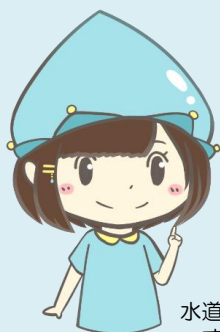
水道マスコット すいちゃん

昭和29年に旧閑上町で小塚原地区の井戸を水源として着工したことが名取市の水道の始まりです。昭和30年には、増田町・閑上町・下増田村・館腰村・愛島村・高館村の2町4カ村が合併し名取町となりましたが、昭和31年その名取町の一部地域に上水道の給水を開始しました。