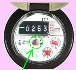
パイロット (水が出ていると回転する)