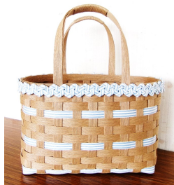
クラフトバンドかご

対象 女性10名 申込期間 6/5 (月)～6/23 (金) 参加費 2,000円 (かご材料・グリーンスムージー2回分を含む)