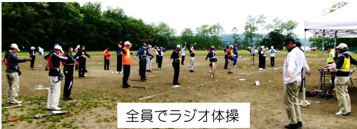
全員でラジオ体操

去る5月15日(月)、箱塚グラウンドを会場に「レクリエーション大会第一弾グラウンドゴルフの部」が、総勢50名の参加で開催されました。運営にご協力いただきました皆さま、ありがとうございました。