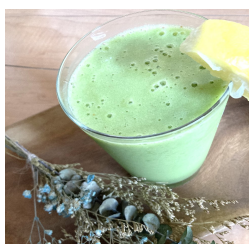
グリーンスムージー