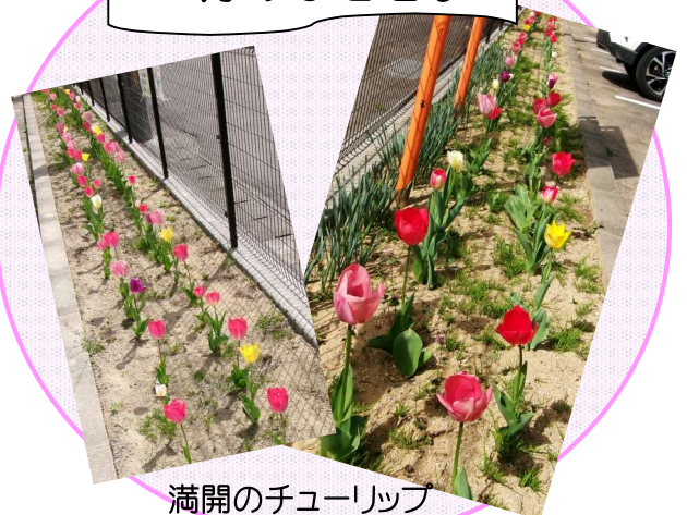
満開のチューリップ