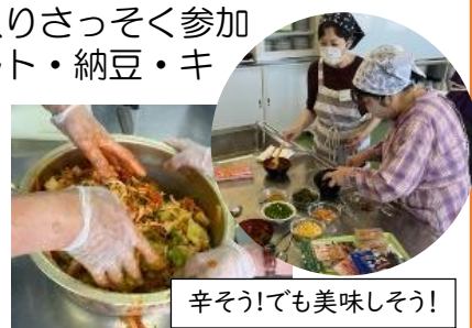
辛そう!でも美味しそう!