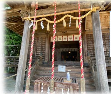
イザナギノミコト イザナミノミコト を主祭神として祀る

神社の由緒によれば、日本武尊が東征の時に勧請されたと伝えられています。その時、日本武尊が重い病気にかかりこの社を建て、武運長久と国家安泰、病気平癒の祈願をし、無事に大和に凱旋したといわれています。