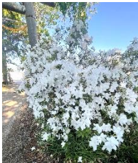
参道脇に咲く さつき (宮司さんの イチオシ!)