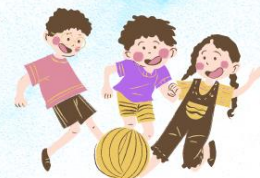
子ども遊び場ブース