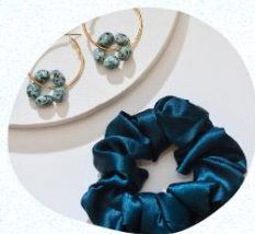
手作りアクセサリ ワークショップ