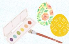
お絵描きワークショップ