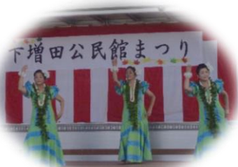
プア・カ・レファ