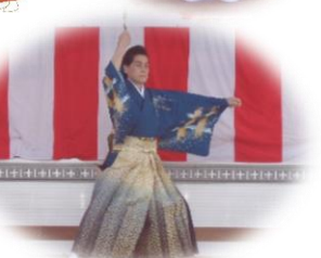
みやび会 (日本舞踊)