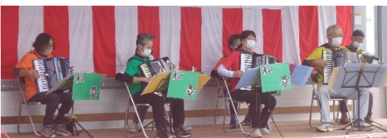
Ne! 風琴 (アコーディオン)