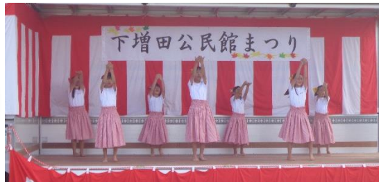
アロハクラブ (踊りフラダンス)