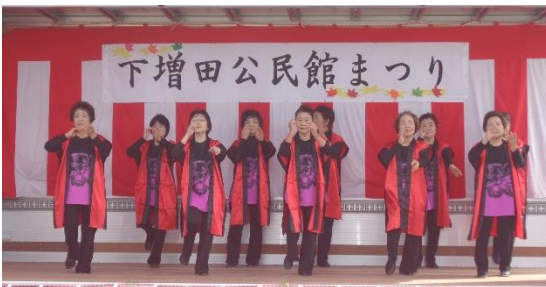
コスモス (レクダンス)