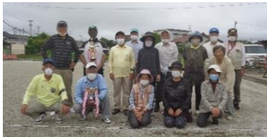
↑ ↓ 昨 年 の 様 子