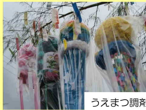
うえまつ調剤薬局隣 ↑