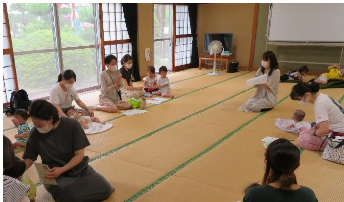
③「どう乗り切るイヤイヤ期」↑