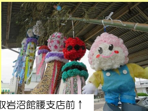
JA 名取岩沼館腰支店前 ↑

館腰駅東口・西口、うえまつ調剤薬局隣、JA 名取岩沼館腰支店前にて、大きな笹の葉にカラフルな七夕飾りが3年ぶりに飾られました。植松地区の子供会で制作したこちらの七夕飾りは、美しく館腰地域を彩りました。