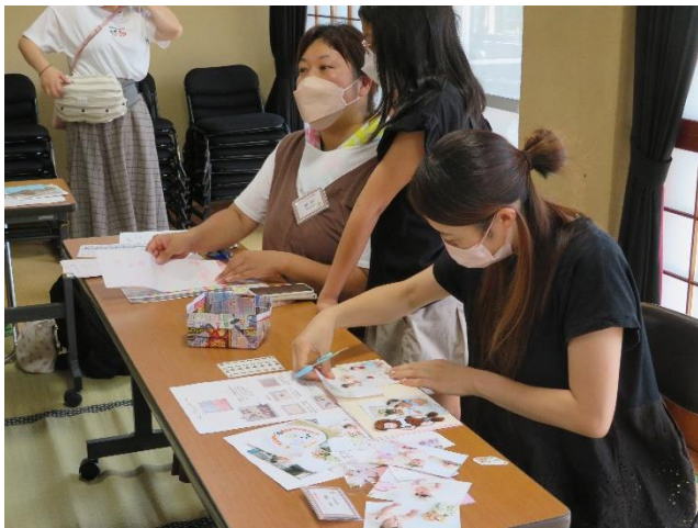
④「フォトアルバムづくり」↑

写真を好きな形に切りとって模様をつけたり、好きな色でデコレーションしたりと、お子様との思い出を飾る素敵なフォトアルバムが完成しました。