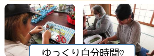
ゆっくり自分時間♡