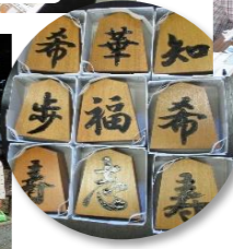
希華知 歩福希 春