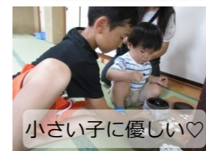
小さい子に優しい♡