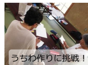
うちわ作りに挑戦!