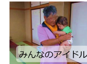
みんなのアイドル