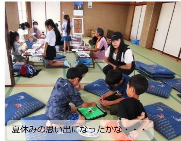
夏休みの思い出になったかな...