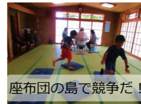
座布団の島で競争だ!