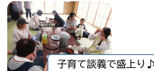
子育て談義で盛り上げ♪