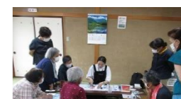
初めての体験☆ 素敵な作品が完成