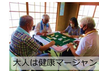
大人は健康マージャン