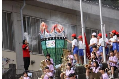
◆2台目：聖火台とみどり台中学校吹奏楽部の演奏