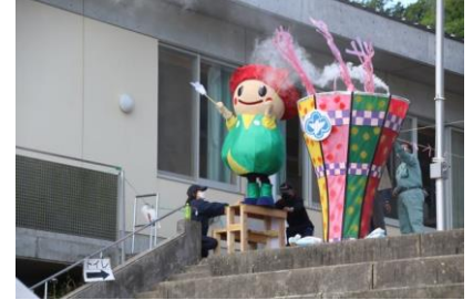
◆3台目：聖火台とカーナくんによる点火