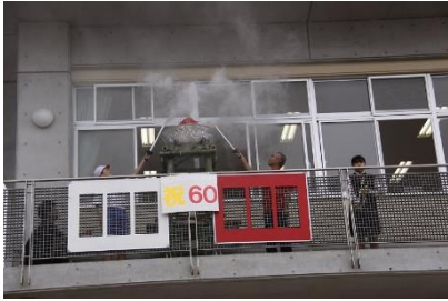
◆1台目：聖火台とトランペット奏者によるファンファーレ

5月28日(土)那智が丘小学校で運動会が開催されました。コロナ禍のため地域との共催は叶いませんでしたが、那智が丘のボランティアメンバー「那智仙人S(なちせんじんず)」の皆様が今年も聖火台を製作し、開会式の演出に協力しました。カーナくんも応援に駆けつけて聖火台へ点火、児童は大喜びでした。ところで、那智が丘小学校運動会の聖火点火式はいつ始まったかご存知ですか。実は、2018年の名取市市制施行60周年記念事業として運動会で聖火リレーを行ったのが始まりです。その時の聖火台は、竹でやぐらを組んだ上部に防災炊き出し用大鍋を載せた「かがり火」スタイルでした。2019年の2台目はカラフルなチューリップタイプで、この時はみどり台中学校吹奏楽部の演奏で開会を盛りあげてくれました。そして今回2022年の3台目は、前回の材料を活用しながらもデザイナー新のスタイルで、町内会のチームカラーをベースに市松模様の帯を施し、正面に那智小の校章を配置した高さ2m、最大径1.4mの大きな聖火台です。那智仙人Sの皆様、ありがとうございました。