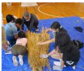
(地域の人と一緒にいったかかしづくり)