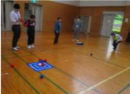
運動不足を解消！健康づくり教室 初めてのポッチャを楽しみました。