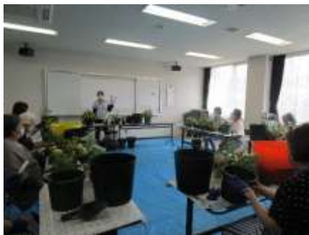
生活向上セミナー 季節の花の寄せ植えに挑戦しました。