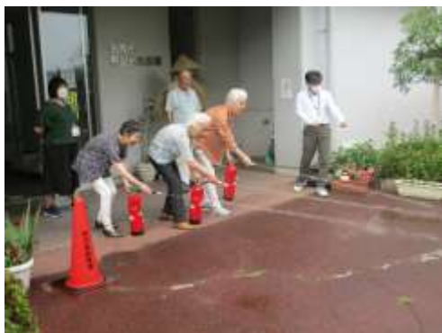
相互台公民館自衛消防訓練を行いました。