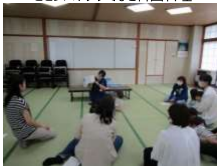
のびのび親子教室 図書館の方から、読み聞かせをしていただきました。