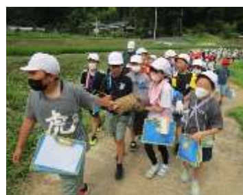
(かかしを運ぶ小学生たち)