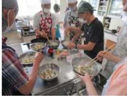
男子力アップ講座 多国籍料理のスタートは ビビンバ、チヂミなど韓国料理

6月から始まった公民館講座も全部で8つの講座が開講しました。 楽しそうな講座の様子をごらんください。