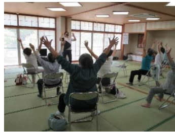
コツコツためよう 「貯筋講座」