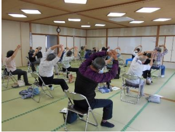
華麗に加齢を！ いきいき教室