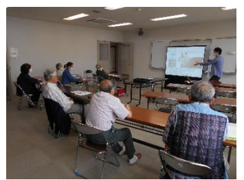
知りたい！備えたい！ 「身近な防災」