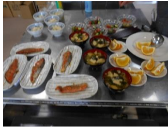
”まごわやさしい” 「ビストロ長寿食」