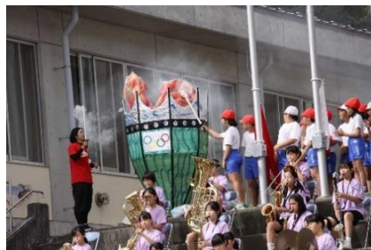
◆2台目：聖火台とみどり台中学校吹奏楽部の演奏