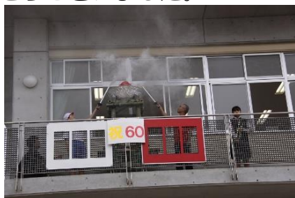
◆1台目：聖火台とトランペット奏者によるファンファーレ

5月28日(土)那智が丘小学校で運動会が開催されました。コロナ禍のため地域との共催は叶いませんでしたが、那智が丘のボランティアメンバー「那智仙人S(なちせんじんず)」の皆様が今年も聖火台を製作し、開会式の演出に協力しました。カーナくんも応援に駆けつけて聖火台へ点火、児童は大喜びでした。ところで、那智が丘小学校運動会の聖火点火式はいつ始まったかご存知ですか。実は、2018年の名取市市制施行60周年記念事業として運動会で聖火リレーを行ったのが始まりです。その時の聖火台は、竹でやぐらを組んだ上部に災害炊き出し用大鍋を載せた「かがり火」スタイルでした。2019年の2台目はカラフルなチューリップタイプで、この時はみどり台中学校吹奏楽部の演奏で開会を盛りあげてくれました。そして今回2022年の3台目は、前回の材料を活用しながらもデザイン一新のスタイルで、町内会のチームカラーをベースに市松模様の帯を施し、正面に那智小の校章を配置した高さ2m、最大径1.4mの大きな聖火台です。那智仙人Sの皆様、ありがとうございました。