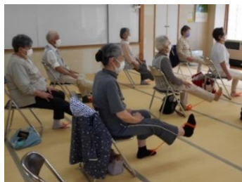
ひらめ筋ストレッチ