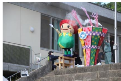
◆3台目：聖火台とカーナくんによる点火