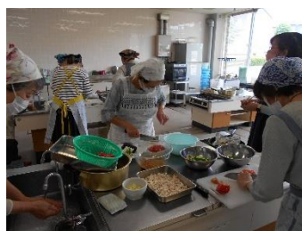
キッチン&ガーデン