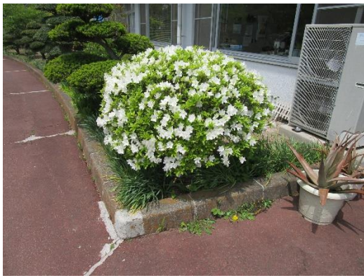
公民館玄関前のアザレア