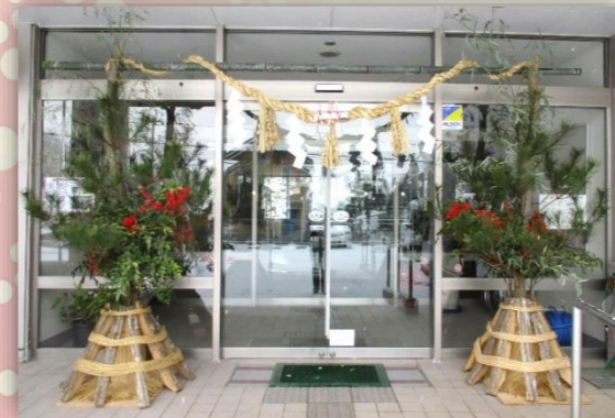
写真は昨年のものです

最後になりましたが、皆様のご健勝とご多幸を心よりお祈り申し上げ、新年のご挨拶といたします。