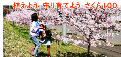
植えよう 守り育てよう さくら100