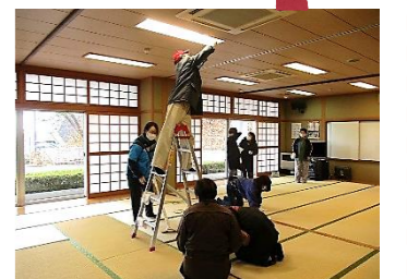
館内もピカピカに!