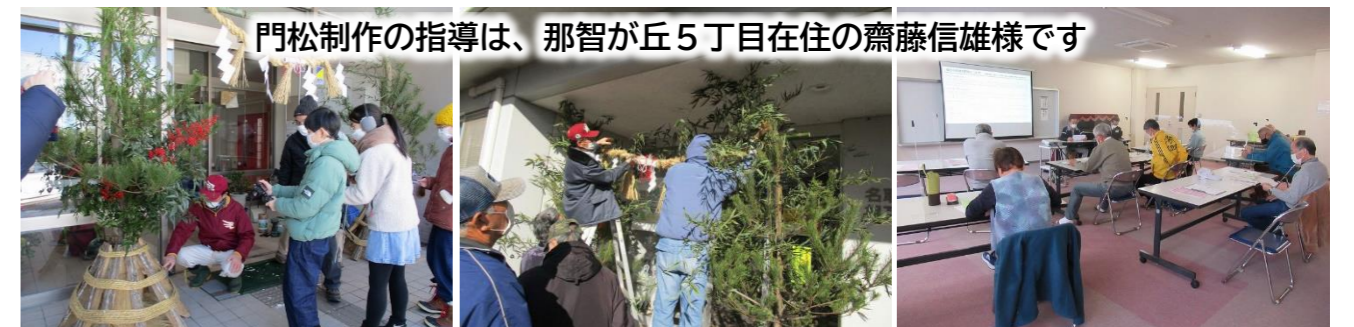
【那智が丘公民館】令和3年度 伝統門松づくり

平成27年度那智が丘公民館講座から始まった伝統的門松作りは今年で8年目。那智が丘の伝統的門松作りは地区を越え、令和3年度から相互台公民館、令和4年度からはゆりが丘公民館で取り組みが始まり、みどり台中学校区の全3館で行われています。門松に込められた地域の皆さんの安全を願う気持ちごと校区全体に広がっていくようで、これからも末永く続くことを願うばかりです。地域間交流も深めていきましょう！