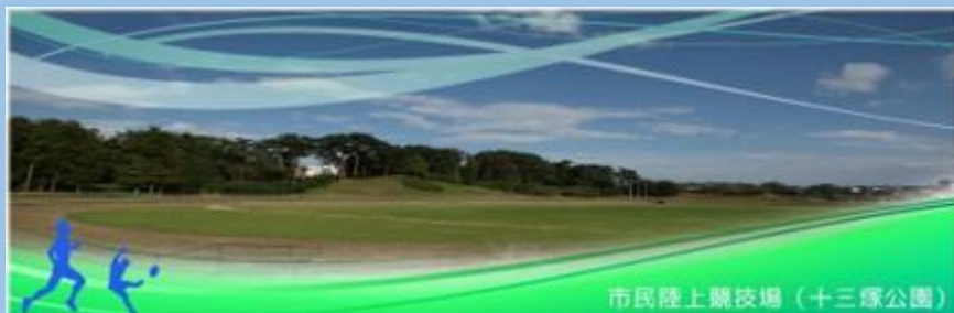
市民陸上競技場（十三塚公園）