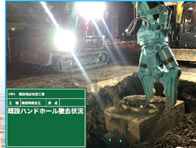
工名 増田地区改良工事 工種 構造物撤去工 期 成 既設ハンドホール撤去状況