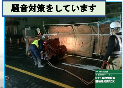
騒音対策をしています