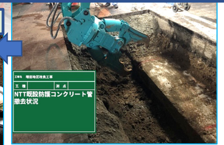
工名 増田地区改良工事 工種 構造物撤去工 期 成 NTT 既設防凍コンクリート管 撤去状況