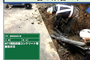
工名 増田地区改良工事 工種 構造物撤去工 期 成 NTT 既設防凍コンクリート管 撤去状況