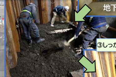
③しっかりと転圧作業を行いました。