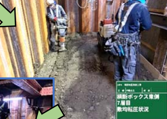
④西側の埋戻しを行いました。