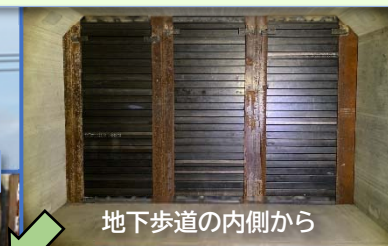
地下歩道の内側から

②横断箇所の地下歩道の設置が完了し、次は西側（名取駅側）の施工に移ります。そのために一度横断箇所の埋戻しを行います。土砂が地下歩道に入り込まないようにふた（閉塞）をしました。