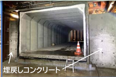
埋戻しコンクリート

①横断箇所の地下歩道は大型地震などの際に道路路面に段差等が出来ないように、周りをコンクリートで埋め戻します。