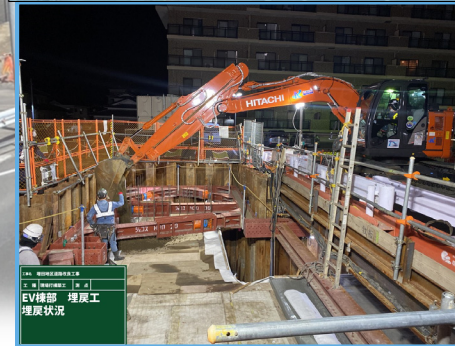
エレベーター周りの一部を埋戻しました。

工事名 増田地区道路改良工事 工種 EV機部 月 4月 現場 EV機部 埋戻工 埋戻状況