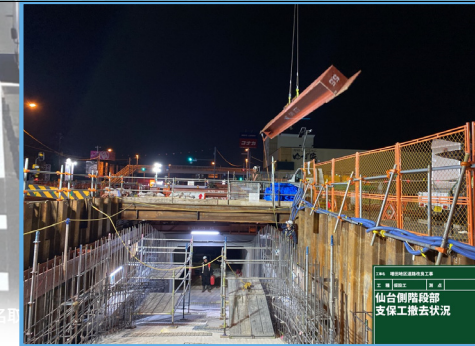
仙台側階段部土留め支保工の一部を解体しました。

工事名 増田地区道路改良工事 工種 土留め支保工 月 4月 現場 仙台側階段部 支保工撤去状況