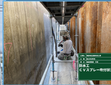
福島側階段部の防水工を行いました。

工事名 増田地区道路改良工事 工種 地下歩道構築 月 4月 現場 福島側階段部 防水工 C Vスプレー吹付状況