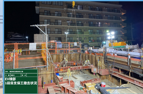
EV部 1段目支保工撤去状況