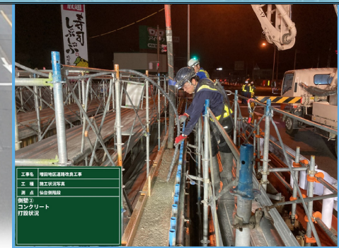
仙台側階段部 コンクリート打設状況