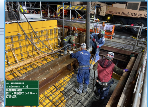
仙台側階段部 コンクリート打設状況