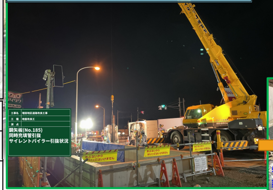
鋼矢板の引抜き(撤去)作業を行っています。