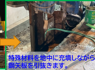
特殊材料を地中に充填しながら鋼矢板を引抜きます。