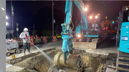
東側の支障物撤去作業を行いました。