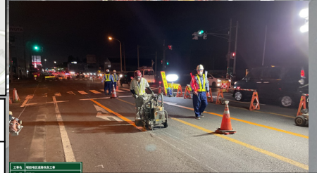
東側工事のために、車線シフト作業として道路の区画線の引き直し作業を行いました。