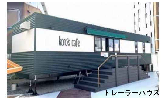
トレーラーハウス

にぎわい再生事業は、市有地や民有地の借地により事業を展開していくものとなります。にぎわい再生の方向性において、「名取駅東地区駅前商店街のコンセプトには、わざわざ行きたくなるような雰囲気演出(お洒落、美味しい、楽しい)など、他にない独自性が必要」と定め、整備には「統一感」や「〇〇らしさ」が重要であると整理しました。施設・店舗は、 移動可能なトレーラーハウスや鉄骨造のコンテナハウスを用いて事業を展開するものとします。