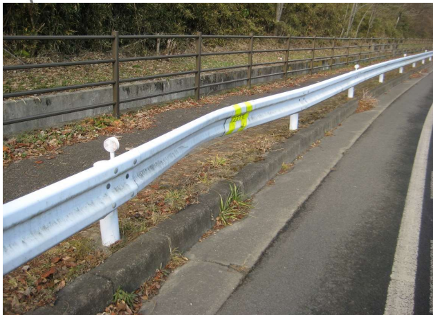
② 補修するガードレール (S→N)