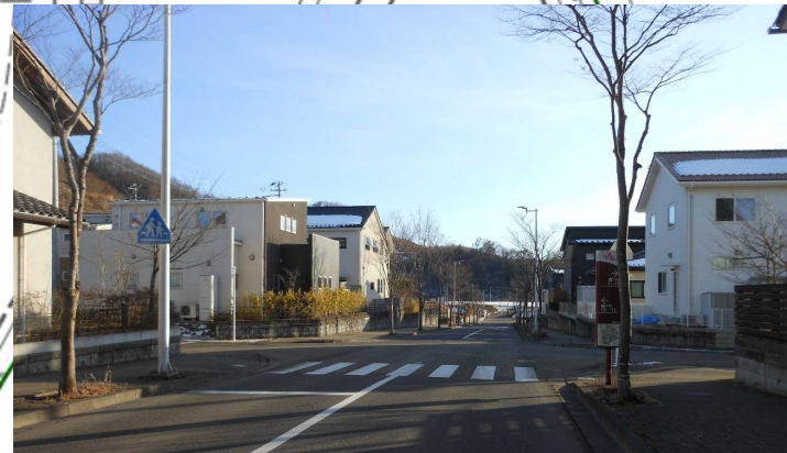
横断歩道・一時停止標識が設置され、路面標示を検討する交差点 (N→S)