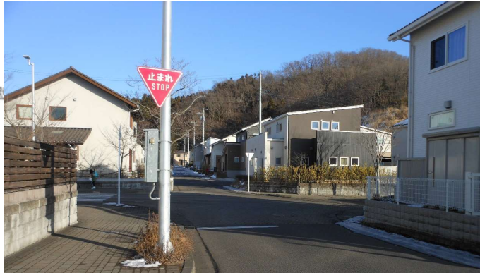
横断歩道・一時停止標識が設置され、路面標示を検討する交差点 (W→E)