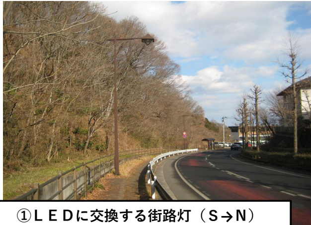
① LEDに交換する街路灯 (S→N)