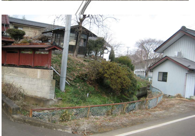
転落防止柵の設置を検討する側溝 (E→W)