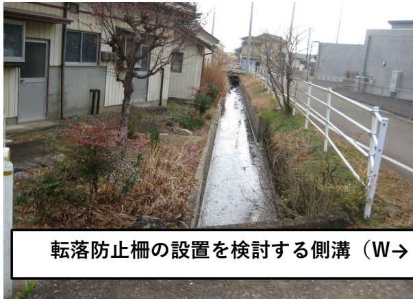
転落防止柵の設置を検討する側溝 (W→E)